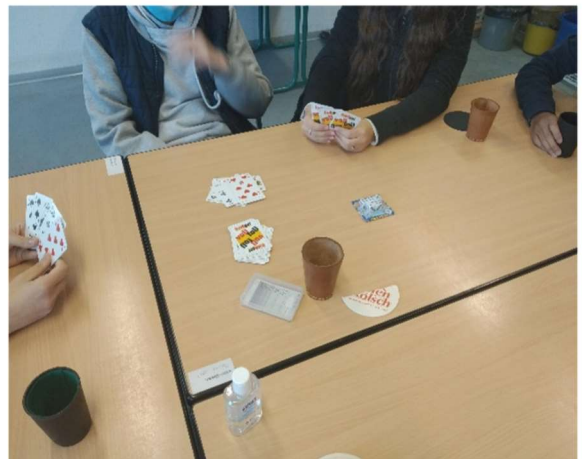
Altbewährt - „Lügen“ und „Schlafmütze“ gab es im Projekt auch als Kartenspiel in der Schule. ;D