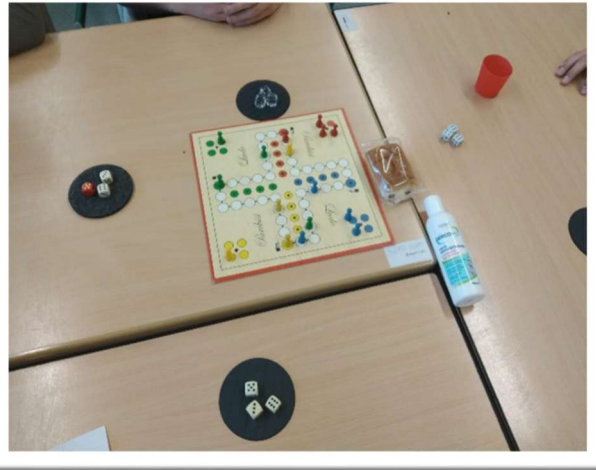
„Mensch ärgere dich nicht“ wohl jeder, aber hast Du es schonmal mit drei Würfeln gespielt? Es gibt viel Grund zur Schadenfreude bzw. zum Ärgern!