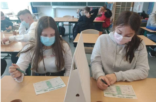
Zwischendurch „Stadt, Land und Fluss“ oder „Schiffe versenken“ war genauso drin wie ...